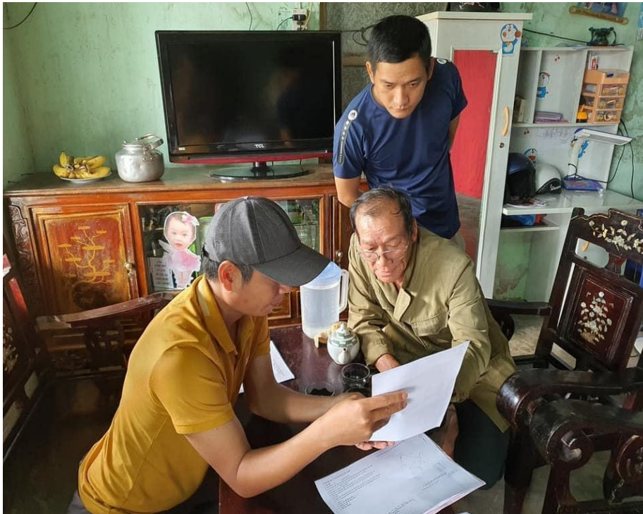
Nhà Chống Lũ cam kết chất lượng kỹ thuật trong hỗ trợ nhà an toàn cho hộ dân

Trên hành trình mới này, các chương trình của DNXH Nhà Chống Lũ dựa trên 4 nguyên tắc sau: