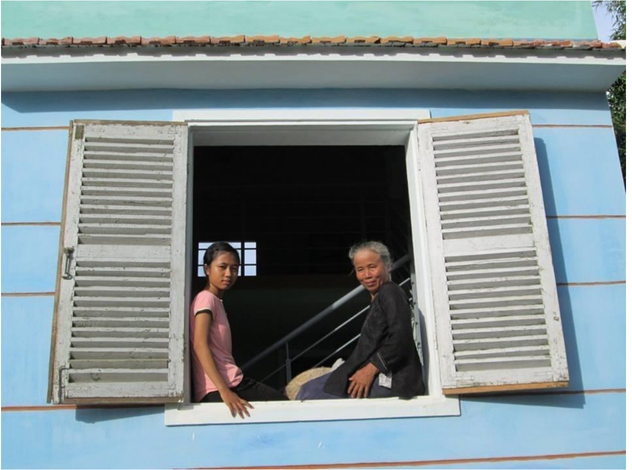
Hộ dân tự tin hơn khi có nhà an toàn